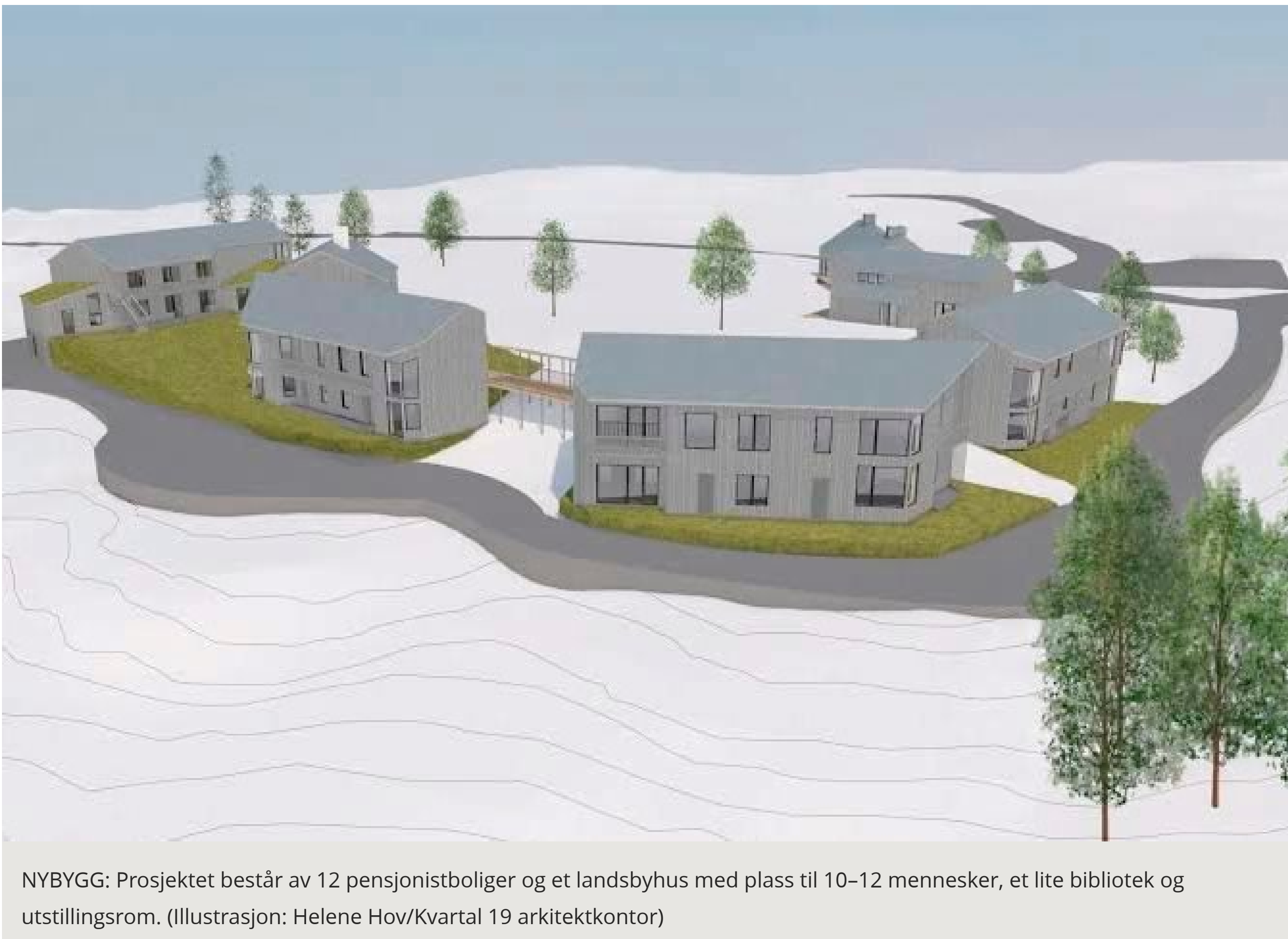
NYBYGG: Prosjektet består av 12 pensjonistboliger og et landsbyhus med plass til 10–12 mennesker, et lite bibliotek og utstillingsrom.